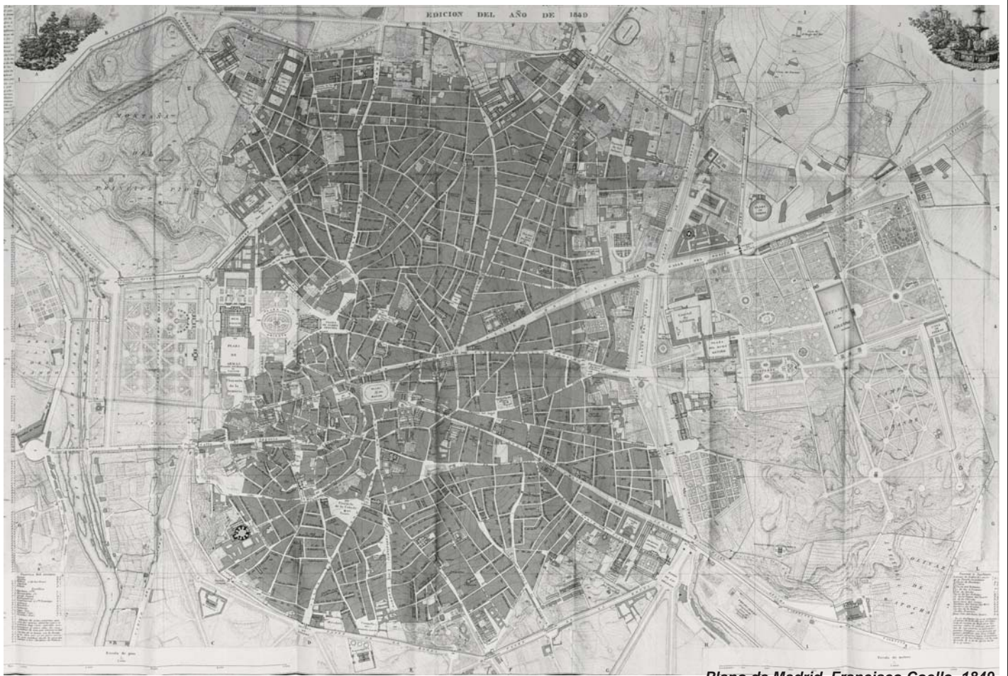
Plano de Madrid. Francisco Coello, 1849.